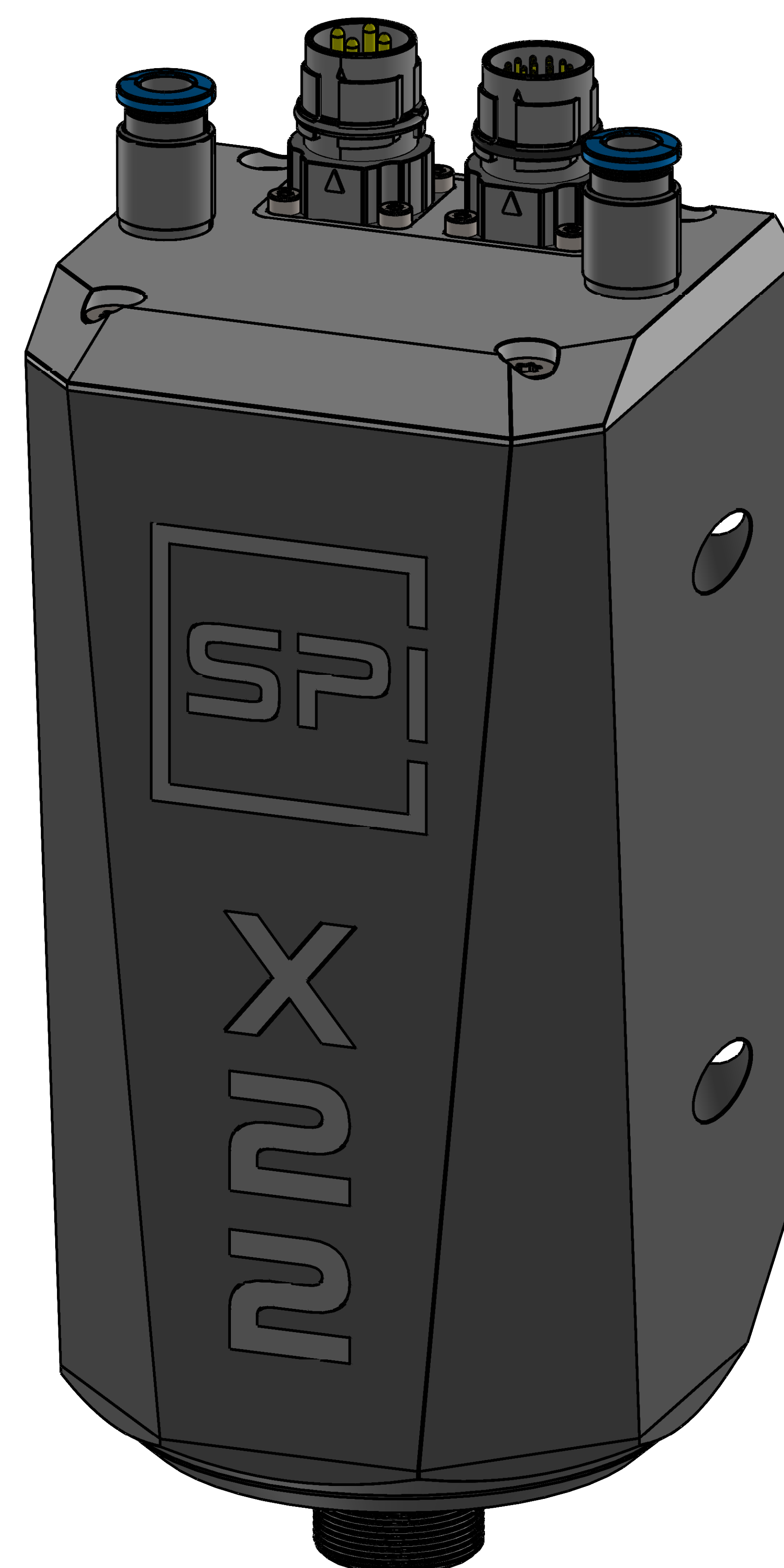
Vollausstattung (Sensorstecker notwendig ab zweitem Sensor)