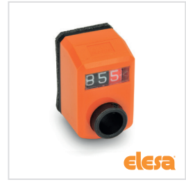
ELESA original design DD50