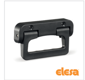
ELESA original design MPE.