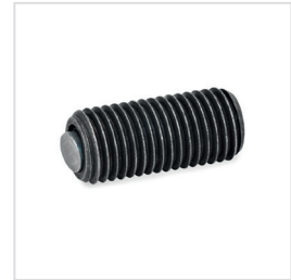
Anwendungsbeispiel verschiedener Pendelelemente mit O-Ring