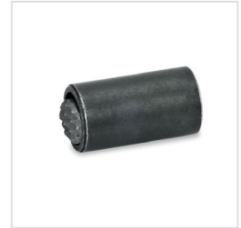
Anwendungsbeispiel verschiedener Pendelelemente mit O-Ring