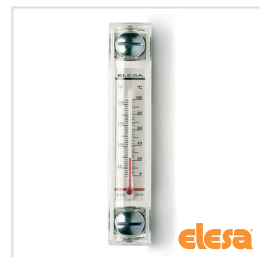
ELESA Original design HCX./HCX-SST