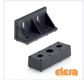
ELESA original design RLT- MB/MS