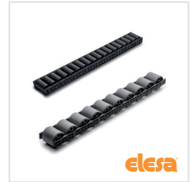
ELESA original design RLT-U