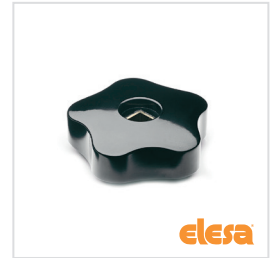
ELESA Original design VCR.192