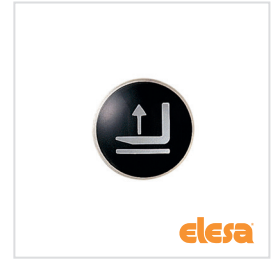
ELESA original design MA.