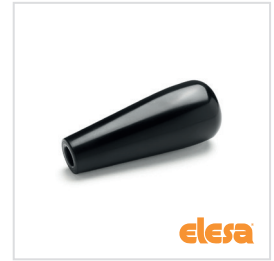
ELESA Original design I.149